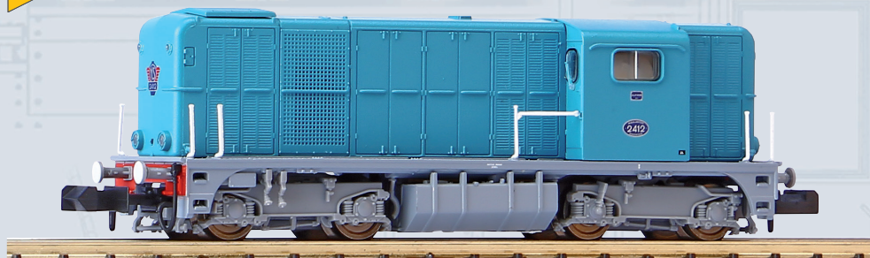
40420 Diesellok Rh 2400 blau NS Ep. III 40421 Diesellok Rh 2400 blau NS Ep. III / Soundlok