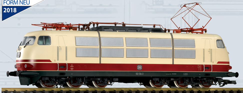
37440 E-Lok BR 103 DB Ep. IV

Die sechsachsigen Elektrolokomotiven der Baureihe 103 galten bei der Deutschen Bundesbahn über viele Jahre als das Flaggschiff im schweren Reisezugverkehr und stellen eine der beliebtesten deutschen Lok-Baureihen dar. Mit der Formneuheit der Kultlok für den TEE und IC Dienst der DB in der Ursprungsausführung mit Pufferverkleidung, Schürze, Scherenstromabnehmer und rot/beiger Lackierung in der kurzen Ausführung erfüllt PIKO einen großen Herzenswunsch vieler Gartenbahner und Liebhaber attraktiver Lokomotiven.