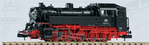
40103 Dampflokom BR 82 DB Ep. IV Soundlok