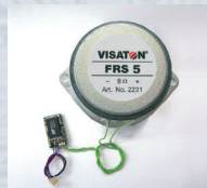
36229 Sound-Modul BR 103 mit wetterbeständigem Lautsprecher