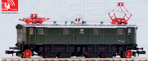
40351 E-Lok BR 116 DB Ep. IV Soundlok

Die PIKO Soundloks der BR 82 sowie der BR 116 sind mit den jeweils passenden modernen PIKO SmartDecoder 4.1 Sound Next18 sowie einem kraftvollen Lautsprecher ausgestattet. Die Decoder beherrschen die Datenformate DCC mit RailComPlus®, Motorola®, Selectrix® und M4.