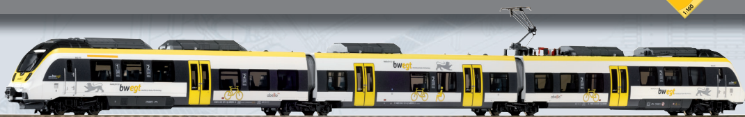
40207 3-tlg. Elektrotriebwagen BR 442 „Talent 2 - Baden-Württemberg Design“ Abellio Ep. VI