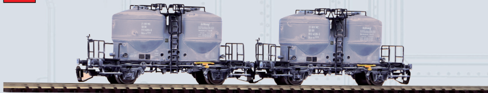
47030 Zementsilowagen DR Ep. IV, 2-er Set, gealtert