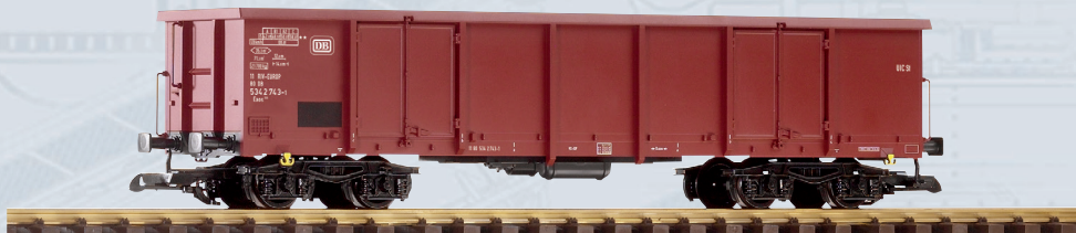
37743 Offener Drehgestellwagen Eaos DB Ep. IV

Ein vorbildgerechter DR-Schnellzug mit der PIKO BR 118 kann authentisch mit den vierachsigen PIKO Reichsbahn-Rekowagen 37650-37652 nachgebildet werden. Wer einen eindrucksvollen Ganzzug als Güterzug bevorzugt, kann auf die PIKO Zementsilowagen 37792 zurückgreifen.