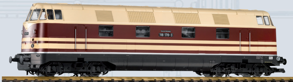
37575 Diesellokomotive BR 118 DR Ep. IV, vierachsrig

Mit dem Gartenbahn Modell der vierachsigen BR 118 der Deutschen Reichsbahn erfüllt PIKO wieder einen Wunsch zahlreicher Gartenbahner und Liebhaber nach attraktiven und eindrucksvollen Großdieselloks.