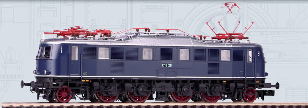
Abbildung zeigt retuschiertes H0 Modell