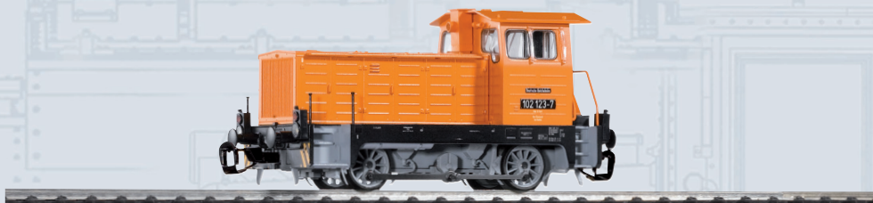
47503 Diesellok 102.1 DR Ep. IV

Die PIKO BR 102.1 besitzt dem Einsatzgebiet entsprechend einen kräftigen Motor mit präzise ausgewuchteter Schwungmasse für sehr gute Fahreigenschaften und ausreichend Zugkräfte für alle vorbildentsprechenden Zuggarnituren. Weitere Highlights des Modells mit feinsten Lackierung und Bedruckung stellen die Führerhausbeleuchtung, die freistehenden Rangiergriffe und Geländer sowie der kleine Feuerlöscher als Blickfang dar. Mit dem fahrtrichtungsabhängigen, automatischen Lichtwechsel weiß/rot ist die separate, digitale Abschaltbarkeit des roten „Rücklichts“ verbunden. Das Modell ist dank einer Next18-Schnittstelle einfach mit modernster Digitaltechnik nachrüstbar.