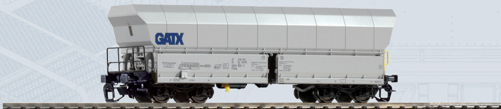
40715 Schüttgutwagen Falns GATX Ep. VI