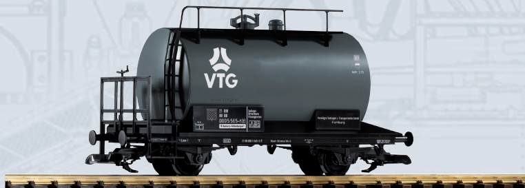
37924 Kesselwagen VTG DB Ep. IV