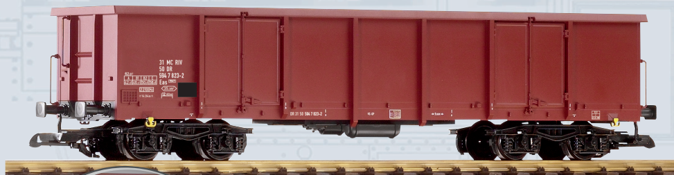
37745 Offener Drehgestellwagen Eas DR Ep. IV