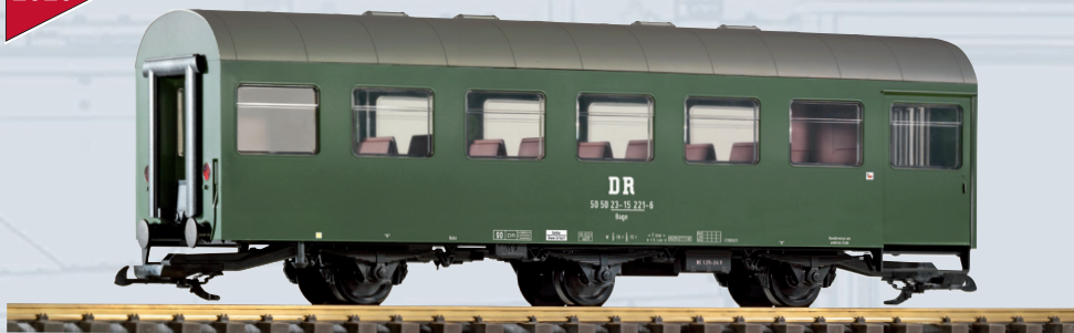
37680 Personenwagen Reko 3achs. Bage DR Ep. IV