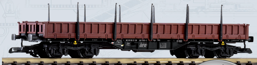
37764 Niederbordwagen Res-x DR Ep. IV