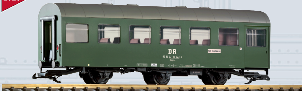
37681 Personenwagen Reko 3achs. Bagtre DR Ep. IV